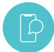
アプリ内メッセージ