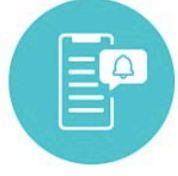
プッシュ通知 お知らせ一覧