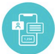
フリーレイアウト